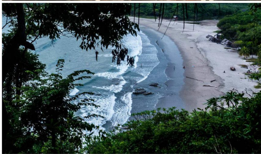
CONTRASTES. Arriba, plaza de León, segunda población en importancia con 206.000 habitantes. Sobre estas líneas, vista de la playa Morgan's Rock desde uno de los "bungalows" mimetizados con la frondosa vegetación en la costa del Pacífico.

BORBOTE DE LAVA. En sus 54 km 2 , el cercano Parque Nacional del Masaya cuenta con dos volcanes, cinco cráteres y más de 20 km de senderos que pueden recorrerse hasta llegar –a pie o en coche– al borde de uno de los cráteres del volcán que le da nombre, uno de los siete activos del país. La experiencia de asomarse al abismo incandescente de su interior y percibir el borboteo de la lava es sobrecogedora.